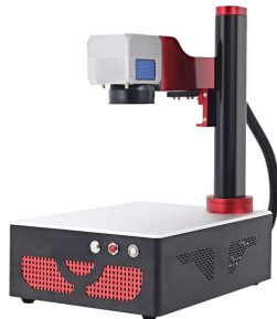
ECO-2 OEM Masaüstü