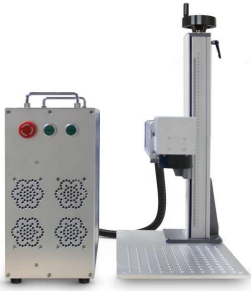
ECO-1 OEM Masaüstü

100.000 Saat Laser Ömrü, 2 Yıl Tam Garanti, Değişim Garantisi, Yerli Tasarım, Yerli Üretim, Fiber veya UV Laser Seçeneği, Laser Kaynağı Alternatifleri.