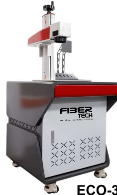
ECO-3 OEM Standlı